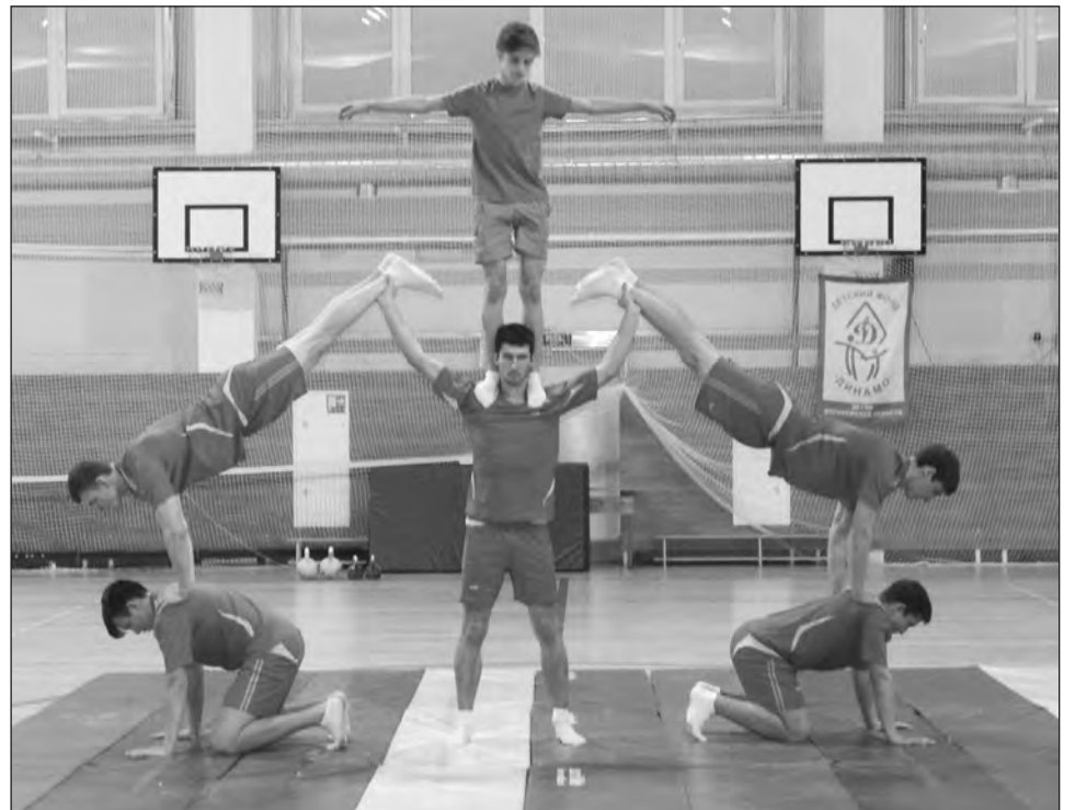
Вот такие пирамиды строили богучарские гиревики

P.S. Двенадцати видам спорта обучают юных богучарцев тренеры-преподаватели Богучарской детско-юношеской спортивной школы.