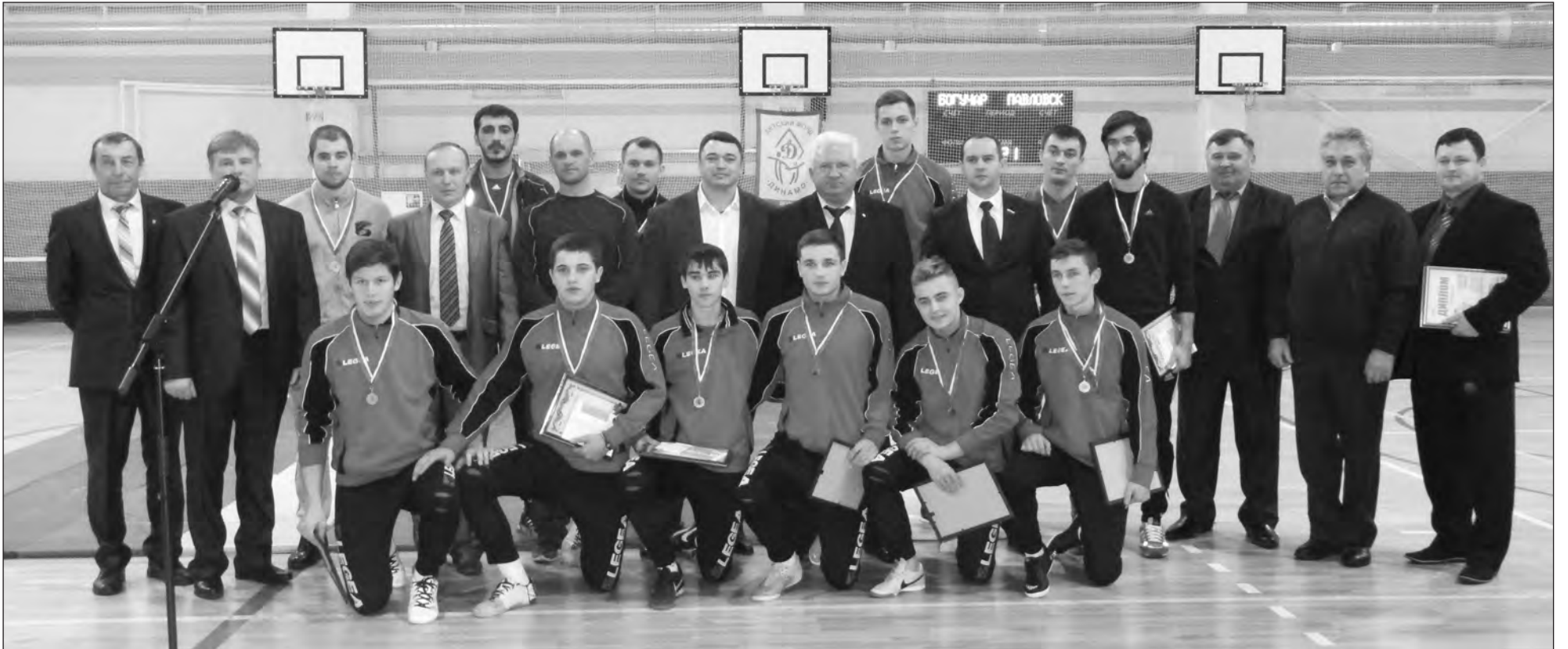
Победы наших спортсменов нельзя назвать случайностью

На спортивной конференции наградили тренеров и их воспитанников, отличившихся в 2015 году