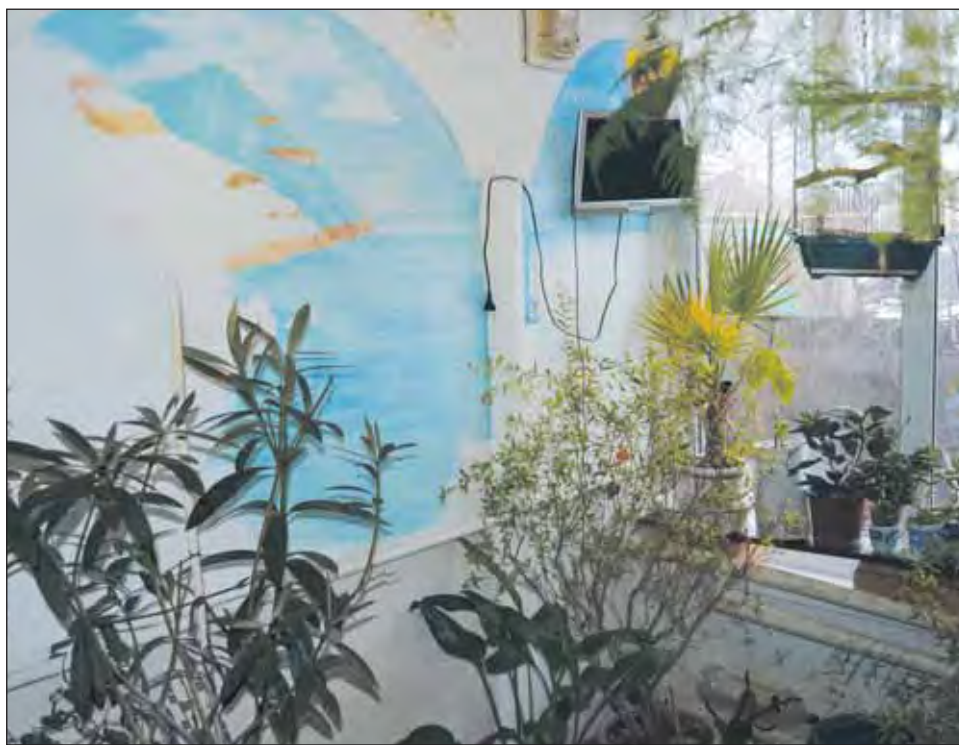
■ На одной из стен дома Ольги Бабаковой вот-вот появится морской пейзаж