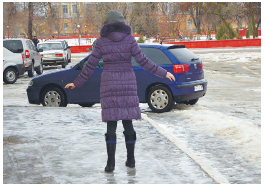
На тротуарах был голый лед

К десяти часам утра 13 января температура воздуха в Богучарском районе поднялась выше нуля градусов. Несмотря на это, ледяная корка, образовавшаяся на тротуарах, таяла очень медленно. Чтобы оградить себя от падений пешеходам приходи-